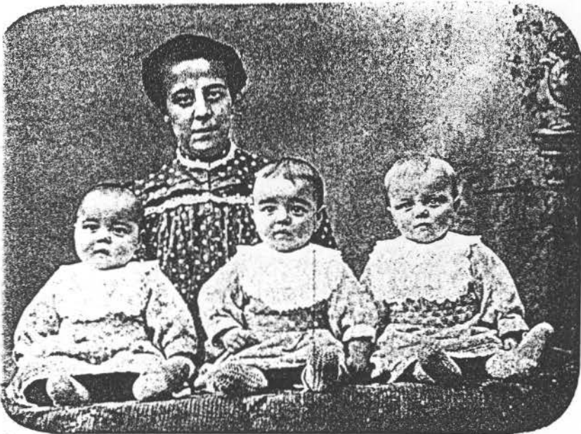
Les trois jumeaux de Laeken et leur mère