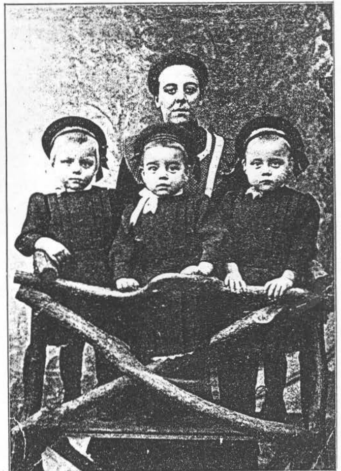
Les trois jumeaux de Laeken et leur mère